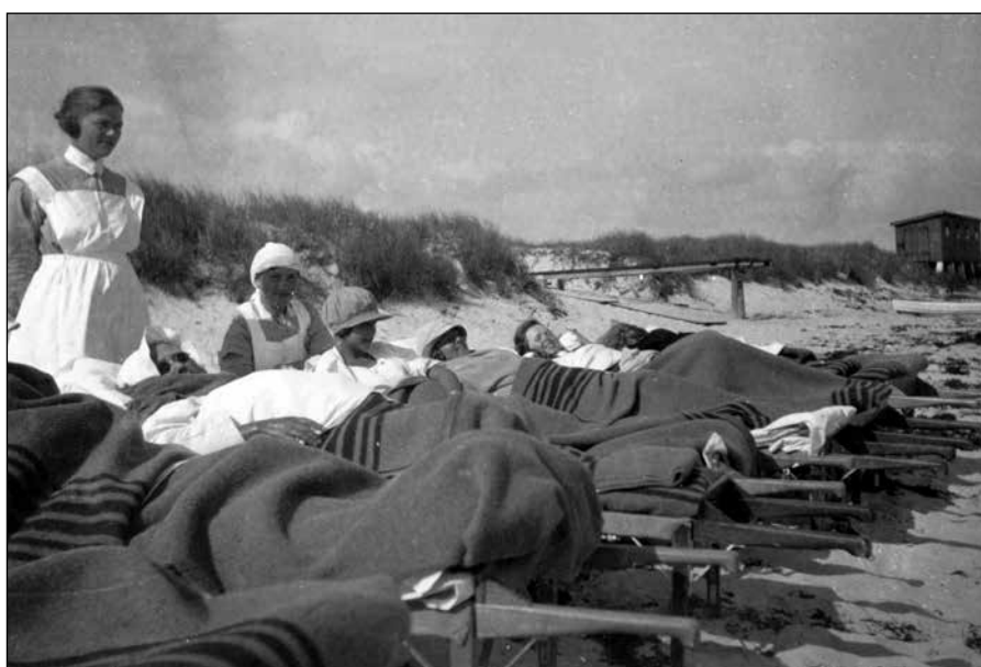
Bilderna ovan: Det är skillnad på att ligga på sal respektive att ligga på stranden. Mycket sol och ljusterapi ingick i läkningen av tuberkulos.