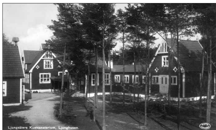
Ljungsäters Kustsanatorium, Ljunghusen.