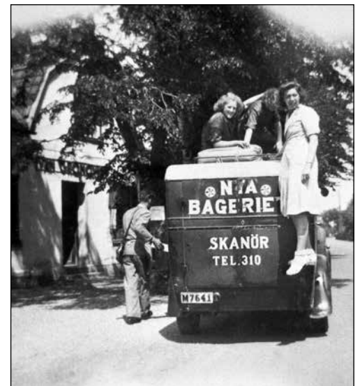
Vi biträden utanför Grönqvists 1945.

Oräkneliga ljusa och mörka bullar har distribuerats därifrån till kunderna på Näset.