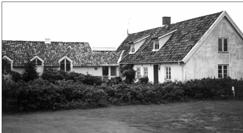
Södra Ljunghuset idag. Här buserar nu Ljungens golfklubbs juniorer.