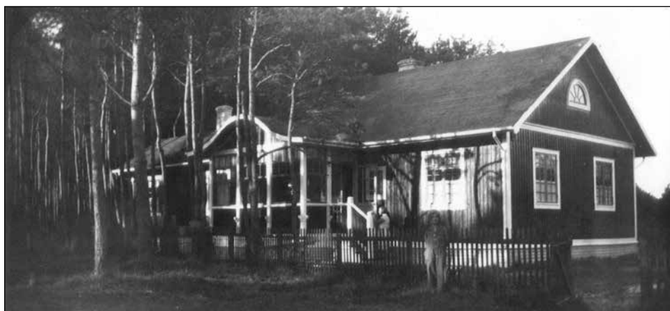
Den röda stugan på Störvägen.