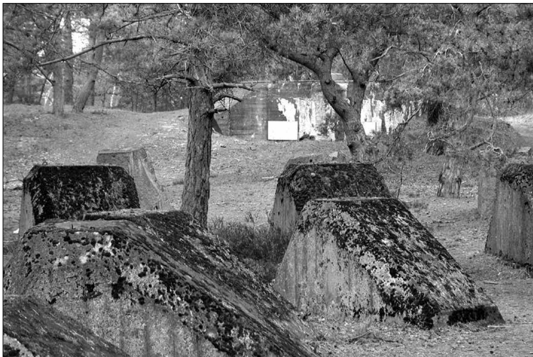
Spärrblock vid Falsterbokanalens.

Försvarsanläggningar längs Falsterbokanalens.