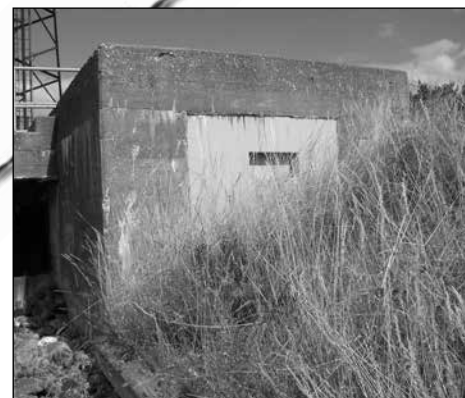
Nedan: Skyttevärn av runt cementrör.