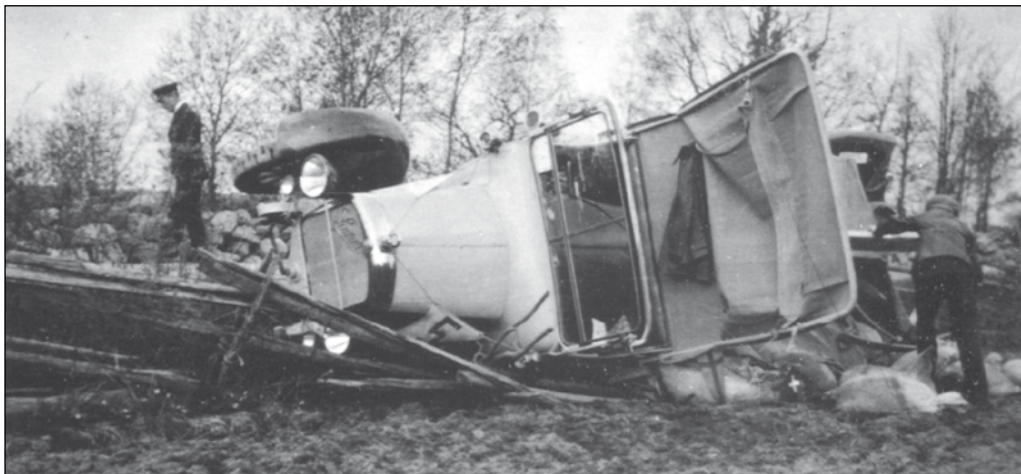
Posten klagade på dåliga vägar! Bilden är i sanningens namn inte från Ljungan.

Oljebekämpning på stranden utföres av föreningen och dess medlemmar.