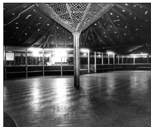
Dansrotundan - Nyckelhålet

Dansken Helge Malmsten tog över på 50 talet. Han byggde teaterscen och radiobilbana samt döpte om det till Teaterparken och tog inträde. Allt blev fiasko och folk slutade att gå dit. Furet revs 1957-1959?