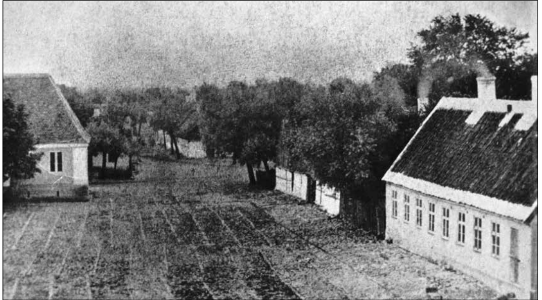
Stora torget i Skanör i slutet på 1860-talet. Skolan till höger, därefter Söderlindska gården som brann ner 1921. Bakom Rådhuset syns det område som brann 1874, den nu försvunna gatan i fonden gick ned mot Lilla Torg.