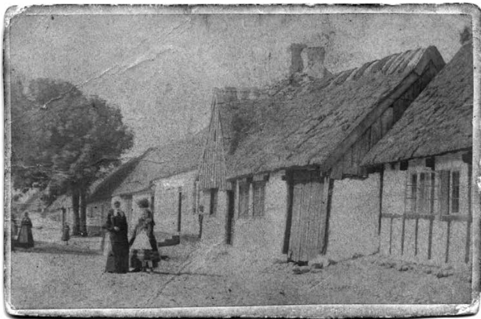
Så här såg Stora Mellangatan ut före de båda bränderna. Bild från slutet av 1860-talet.

Den nya stadsplanen var modern, tagen efter senaste modet från Paris. Den följde det så kallade Esplanadsystemet vilket för Skanörs del innebar att man breddade och rätade ut de tre huvudgatorna, planterade träd och lade ut fyrkantiga kvarter med luft emellan. De berömda avhuggna hörnen hörde till konceptet, de var till för att släppa in ljus i de mindre sidogatorna. I Paris alltså. I Skanör fyller de ingen som