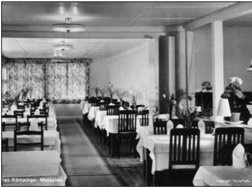
Kämpinge Strandhotell – Jönssons