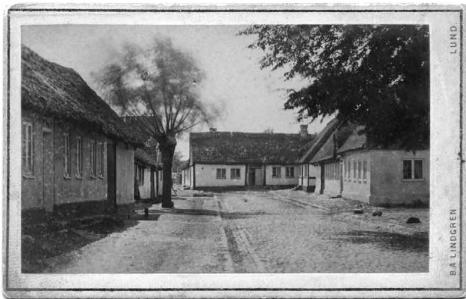
Den här bilden från 1878-79 visar Östergatan mot söder. Fotografen Berndt August Lindgren från Lund stod i korsningen med Kaptensgatan. Alla gårdarna brann ner 1885.

Skanör var ingen vacker stad där den låg, nedsjunkna i sanden, med endast de tre stora gatorna stensatta. Djupa spår