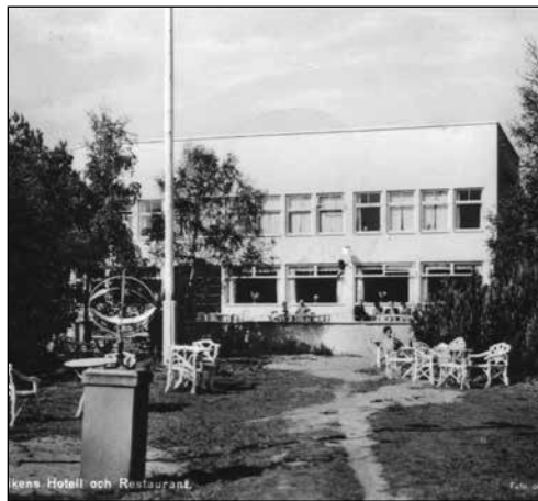
Höllvikens hotell och restaurant

Här nedan följer lite spridda anteckningar om de olika förlusteställena. Vi skulle vara mycket tacksamma om ni som läser detta delgav oss era upplevelser från den här tiden. Ett telefonsamtal, mail, brev eller bara haffa oss på gatan och berätta en historia. Vi behöver er medverkan för att kunna skriva historien om den tid då polisen fick enkelrikta trottoarerna för att publiken skulle kunna komma fram till dansbanorna.