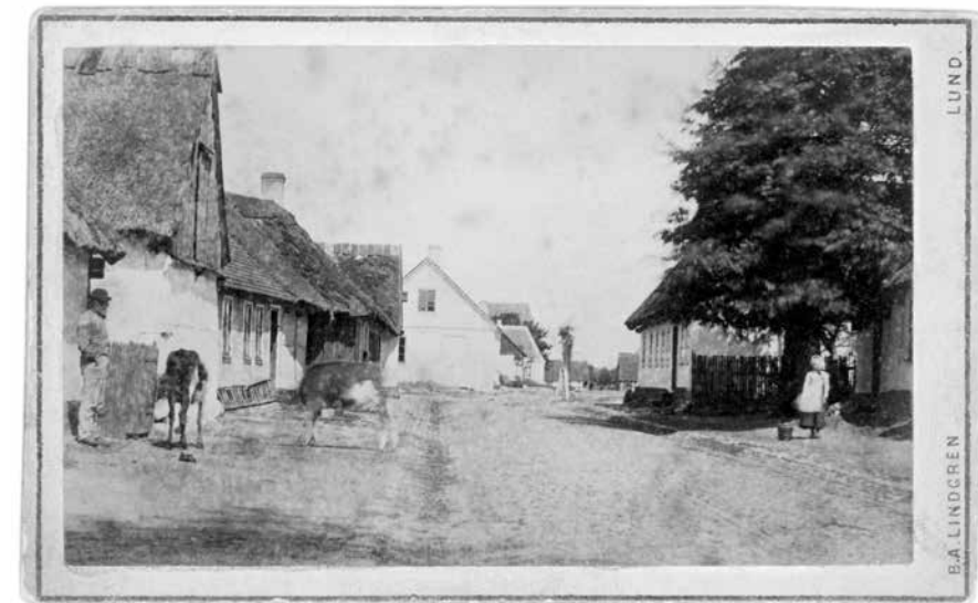
Östergatan norrut med rådhuset och kyrkan i bakgrunden

landtungan och funnit, att höga tornspirer och stora hus med hanseatiska trappgaflar der skulle taga sig förträffligt ut under en skog af skeppsmaster. Wi ha mött åtskilliga personer, som redan olycksplatsen i ögnasigte, wi ha mött länets höfding som tidigt på morgonen rest ditut för att ordna och hjälpa. Han reser i öppen wagn och för sjelf i den bitande stormen sina förträffliga springare. Bygden blir glesare, wi komma allt närmare ned mot hafsbugten. Vägen böjer af till höger utåt landtungan; här är den sista stugan, här har plojen gjort ett sista försök, säkert temligen lönlöst, här widtager heden. Nu är hafwet till nästan det enda som ger tecken till lif; i land blommar wid wäggkanten en förkrympt Salix, för öfrigt den liflösa tomma, gråbruna heden, så långt ögat når. Snart synas en rad telegrafstolpar, och det är redan en omvexlig. En lång förpostkedja, civilisationens budbärare till denna avlägsna vrå af werlden, en nära förbindelse mellan yttersta utkanten och den öfriga delen af vårt land. Ännu fara wi förbi några stugor och några åkerlappar, inhägnade med gården af hafstång. Några träd stå här och der, skälfwande i stormen, och nu blir en hel liten ungskogspark synlig. Den är planterad, och rätt så. Her