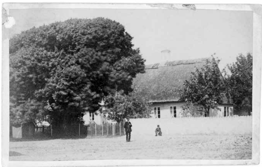
Prästgården före branden.

är dyrt, skatterna äro dryga: mer än sex gånger bevillningskronan, och hwar skall det tagas nu? När inte heller sjöfarten går bra, och så man mister det lilla en har i land, då är det snart intet hopp mer. Skanör har varit en fredlig och bra by, men nu ser det ut, som om man inte skulle kunna hålla sig här längre.»