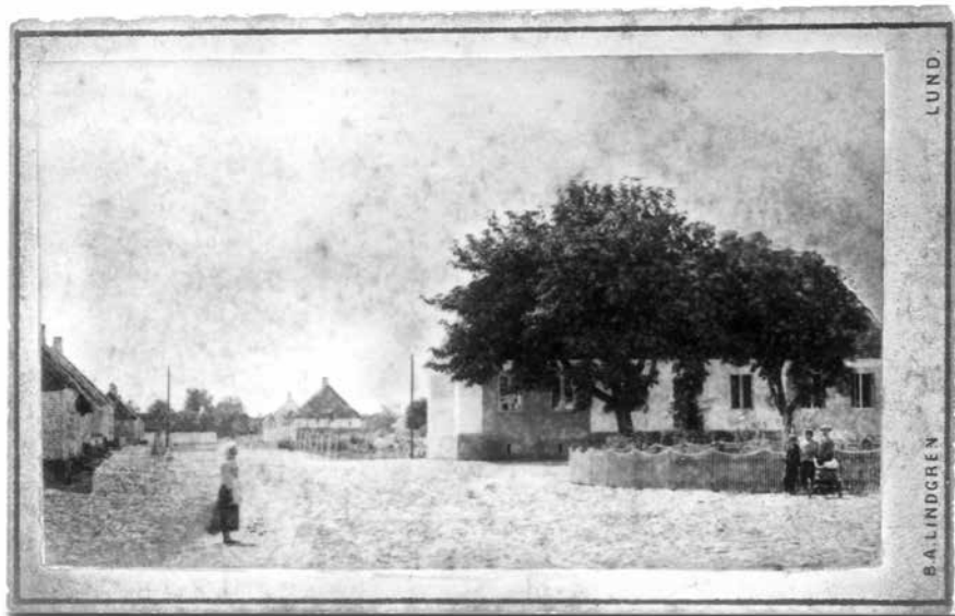
Östergatan söderut från rådhusstorget. Husen bakom rådhuset är uppbyggda efter branden 1874.

heden är ödsligare än någonsin. Ett välkommet livgifwande stafage i denna bild är en flock rådjur, fem med sirliga steg trippar längs vägen, nyfiket betraktande vårt åkdon. Kanske är omvexlingen lika kär för dem, som för oss.