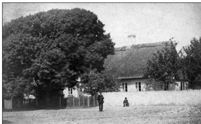
Jöns Rönbecks prästgård som brann ned 1885 Låg något närmare kyrkan.

Båda svarade undvikande på frågorna och spelade helt omedvetna om allt bortom Skanörs horisont. När danskarna insåg att de inte kunde få mer information, fördes de torsdagen 22 januari vid halv tolvtiden på dagen – efter fyra dagars fångenskap och förhör åter ombord på en slup. Med denna fördes de sedan till Östa haken, nordost om Falsterbonäsets nordspets, Knösen, där de klockan sju på kvällen sattes i det midjedjupa vinterkalla vattnet, fortfarande i stort sett bara iklädda vad de hade på sig då de släpades ur sina sängar. I mörker och snö fick de sedan ta sig till stranden för att till fots fortsätta den återstående ca 4 km