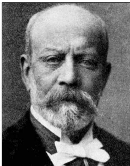
Coifitz Beck-Friis, 1824–1897.

Cammarherren Grefve Corfitz Beck-Friis lätit instänga många Tunneland af Skanörs Ljung, däraf en del är med fur, gran och björk besädd, och hvarmed allt framgent kommer att fortsättas«. En ytterligare senare greve Corfitz Beck-Friis sålde 1896 området – omfattande ca 450 tunnland – till ett konsortium, företrätt av grosshandlare Johan Kock i Trelleborg. Priset var 100.000 kronor dvs cirka 4,4 öre per kvadratmeter. I juni 1904 bildades sedan AB Ljungskogens Strandbad, som övertog marken. Tre år senare utvidgade bolaget sina ägor i väster inklusive både Norra och Södra Ljunghuset – med ca 150 tunnland, inköpta från staden Skanör-Falsterbo för 71.000:-. Priset motsvarade den gången ca 9,5 öre per kvadratmeter, men då ingick förstås även såväl Södra som Norra Ljunghuset.