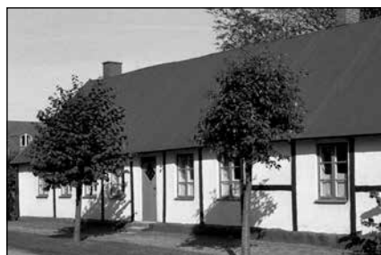
Dykerigården på Dykerigatan.