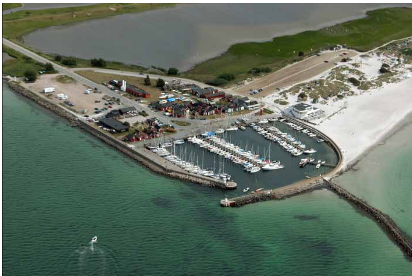
Nedan: Sommaren 2007 före »Badhytten« brann ner.