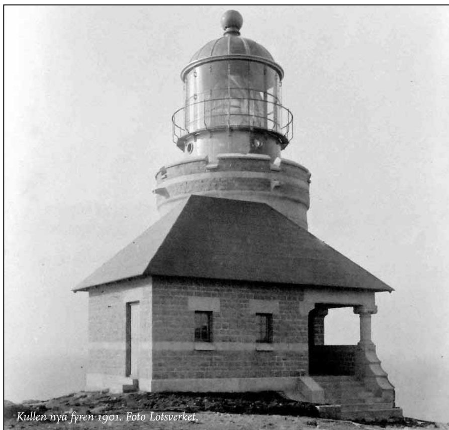
Kullen nya fyren 1901.