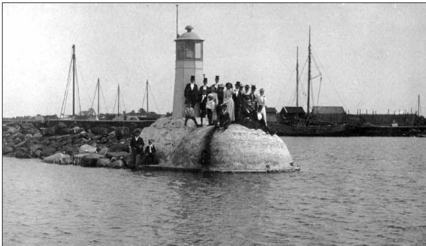
Till vänster: Här ligger den övergivna cementfabriken ensam i hamnen 1927.

Både maskiner och byggmaterialet såldes med tiden.