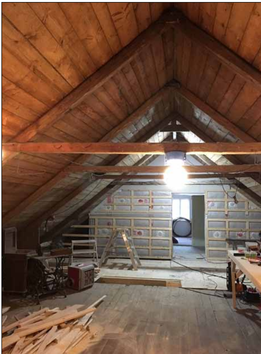
Logen under renovering 2019.

Som vi skrev i början av artikeln så brann korsvirkesgården ner till