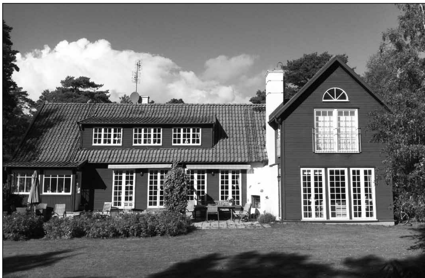
Villa Optimism i sin nuvarande skepnad.