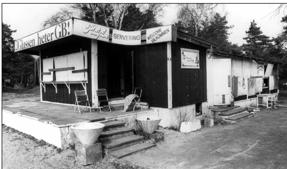
Playan, vandaler har varit framme.