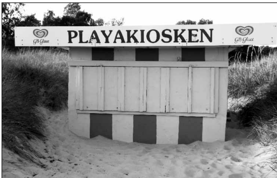
Playakiosken av idag.