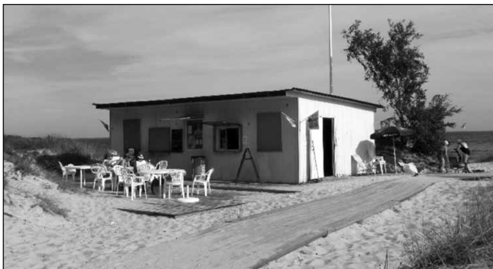
Fortfarande kvar, öppet på sommaren vid fint väder.