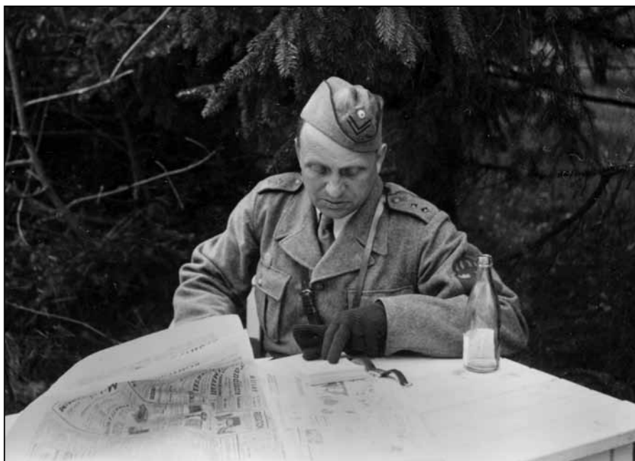
Ovan: Här ser vi plutonchefen, som var väverichef.

Bra start alltså. Sedan följde ett orienteringsmoment, som mest påminde om en terränglöpningsbana på ett par kilometer. Övriga