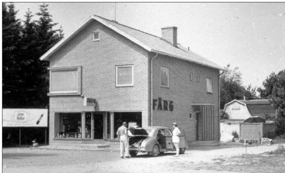
Färg och kemikalieaffären ligger kvar i samma hus. Till höger låg en liten stuga med Hemslöjd.