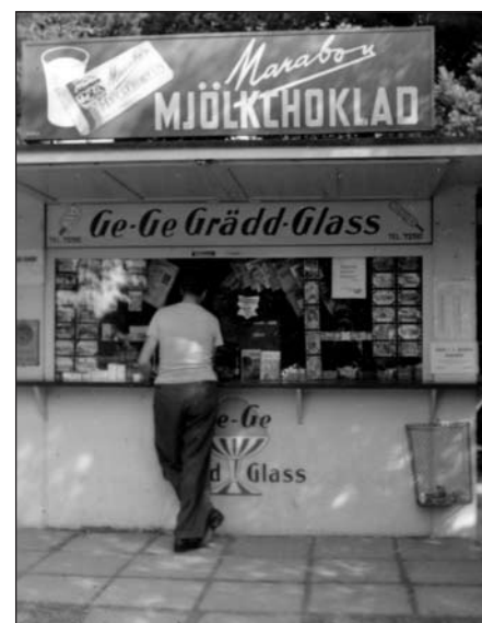
Gyllebokiosken på 50-talet. Här ligger numera Wendts blommor.