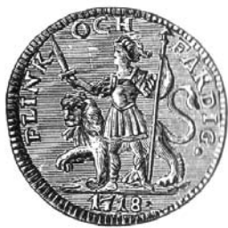
Nödmyntet »Flink och Färdig«.