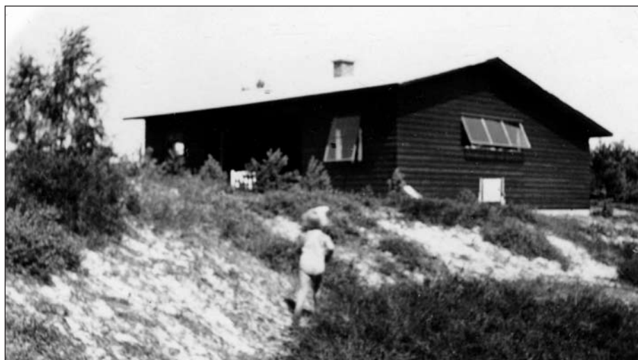
Stugan på Karlsrovägen.

Solen skiner, det är sommar. Jag tar fram min cykel och ger mig ut på en cykeltur. När jag går förbi brevlådan på grinden till Karlsrovägen 13 kan jag som vanligt inte låta bli att titta i den. Det kan ju hända att där ligger ett brev till mig. Ack nej! Så sätter jag mig upp på cykeln och cyklar iväg. Jag cyklar Karlsrovägen fram förbi Leths, Stavnes och alla de andra. När jag svängt om hörnet till Hammarshusvägen kommer den gamla damens schäfer springande och skäller lite, men jag nonchalerar den. Jag har lite pengar med mig så jag cyklar in på stigen till vänster och stannar vid Ljungbaren och köper