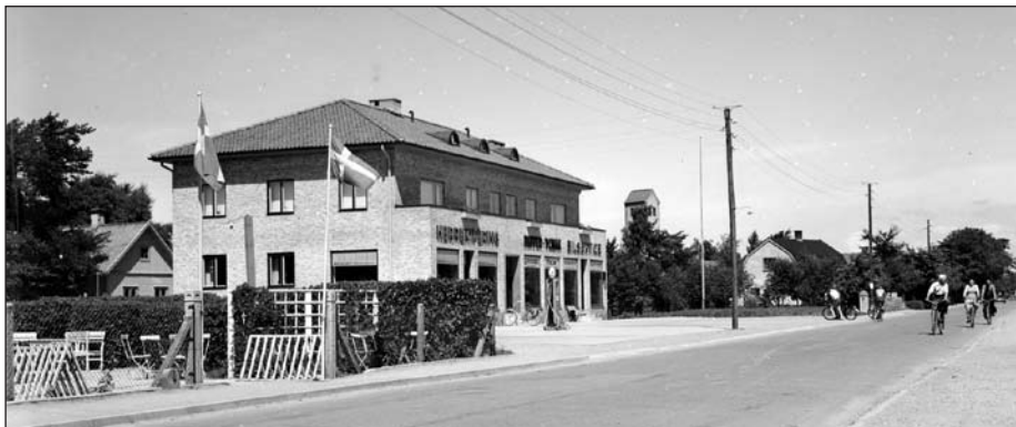
När jag kommer till Anderbergs pappershandel stannar jag och tittar in i skyltfönstret. Jag tar mig en titt i Herrbeklädnadsfönstret också. Det kommer en sagolik doft från kaféet av nybakade bullar.