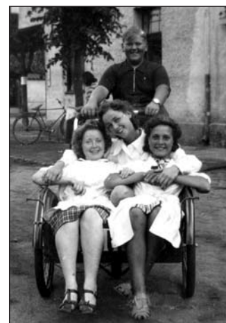
Bildexempel. Personalen på Nyströms i Falsterbo fotograferade på Gröna torg. Känner du igen någon?