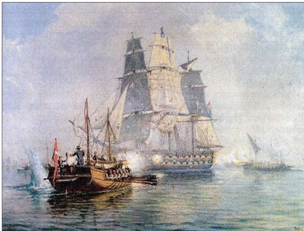
Danska kanonbåtar angriper det engelska örlogsfartyget »Africa«.