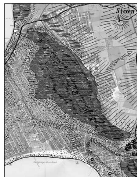
Fig. 5. Kämpinge mosse täckte ett stort område mellan nuvarande Gamleväg, Stenbocks väg och Fädriften mer mot Kämpinge by. Här har Skånska rekognoseringskartan från 1812-20 lagts ovanpå Ekonomiska kartan från 1986.