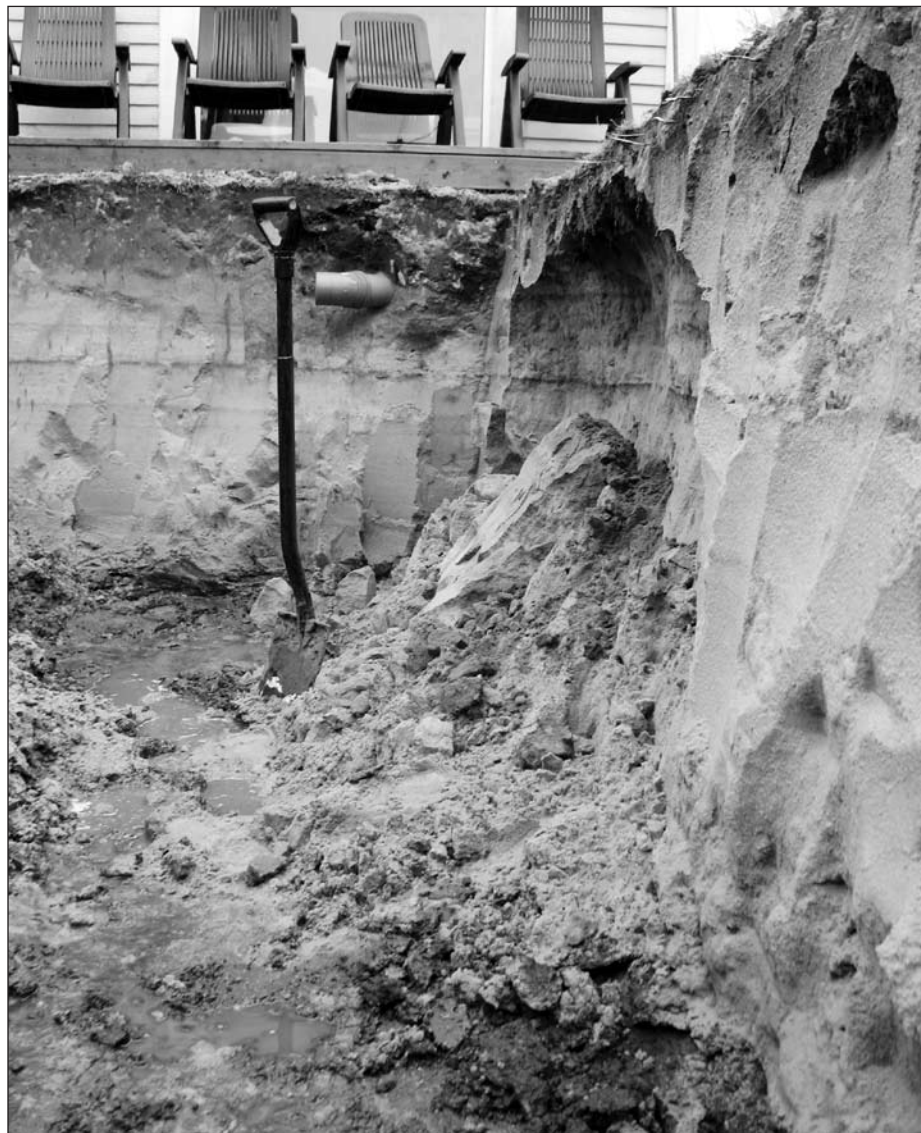
Fig. 4. Poolgrävning vid Kämpinge mosse. 6 000 år gammal.

C-14-dateringar av två fynd, en människokäke och ett ben från nötboskap, funna på stranden i Falsterbo, visade sig vara vikingatida. Kulturlager från slutet av vikingati-