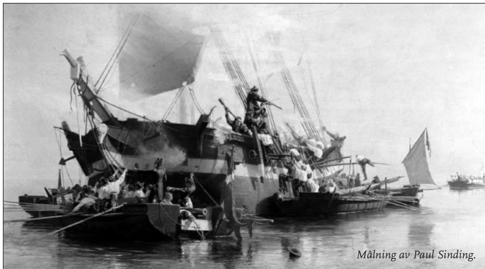
Målning av Paul Sinding.

Så var det kanske inte tänkt när vi samlade in bilderna, då användes dom bara till böcker, utställningar och föredrag, men efterhand som det digitala arkivet har växt har det också blivit mer eftertraktat.