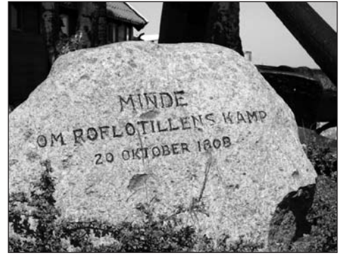
Minnessten i Dragör

Livet ombord på en kanonbåt var hårt. Det fanns inga hytter eller kojor och ingen kabys ombord. Ofta låg båtarna ute veckor i sträck. Besättningen blev genomvåt. De sov på tofterna, fick ro och slåss och fick bara i sig några skorpor och en sup.