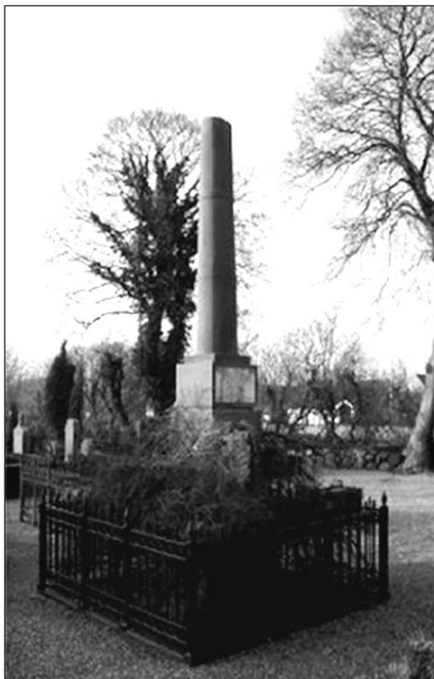
Gemensamhetsgrav på Store Magleby kyrkogård med texten: I blodig Kamp För den Retfædigste sag Faldt 25 af Danmarks sønner paa Roflotillen under Falsterbo Den 20 october 1808.

Det finns de ombord på skeppet som varit med vid Lord Nelson's sista sjöslag vid Trafalgar och som säger att detta var hårdare än Trafalgar.