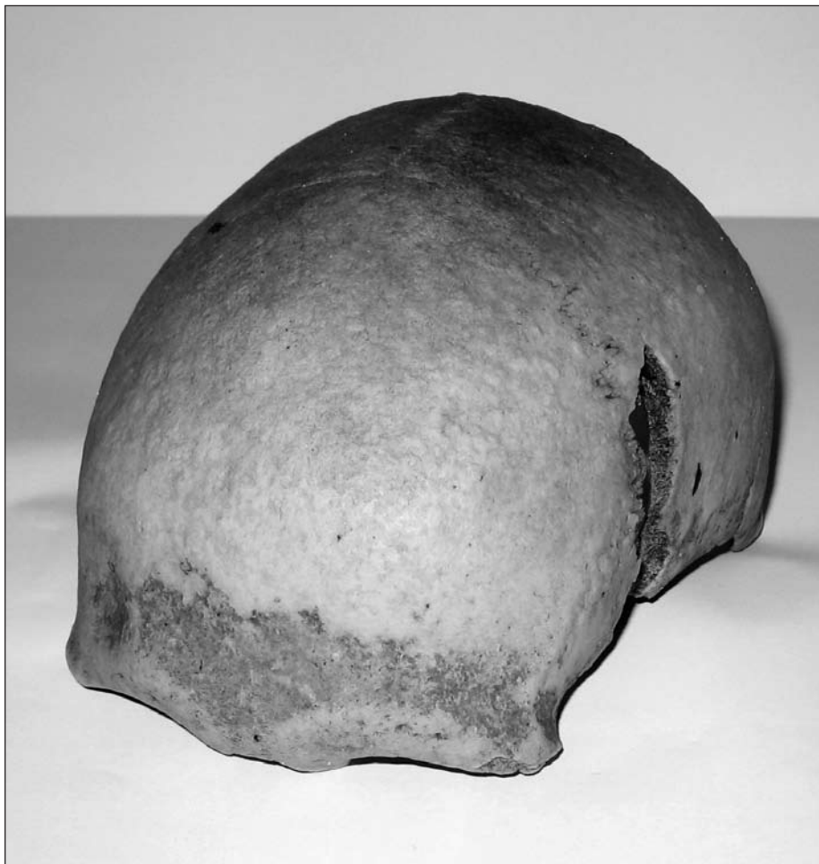
Ovan: Fig. 2. Människoskalle från Måkläppen. 6 000 år gammal. Nedan: Fig. 3. Bronsåldershögen vid Kungstorp.

I fornlämningsområdet, på fältet norr om Kämpinge by, finns ett omfattande boplatsoområde från samma tid. Ett fynd av guldmünt har också gjorts i Kämpinge.