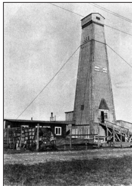
Till vänster: Borrtornet vid Rabyvägen.

I Skåne borrhär man på flera platser. I Norrevång, Barsebäck, Mossshed-