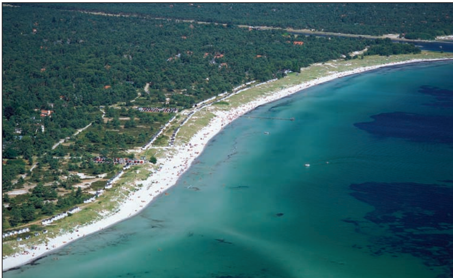
Ljungskogen, med kanalen som ett streck överst i bild