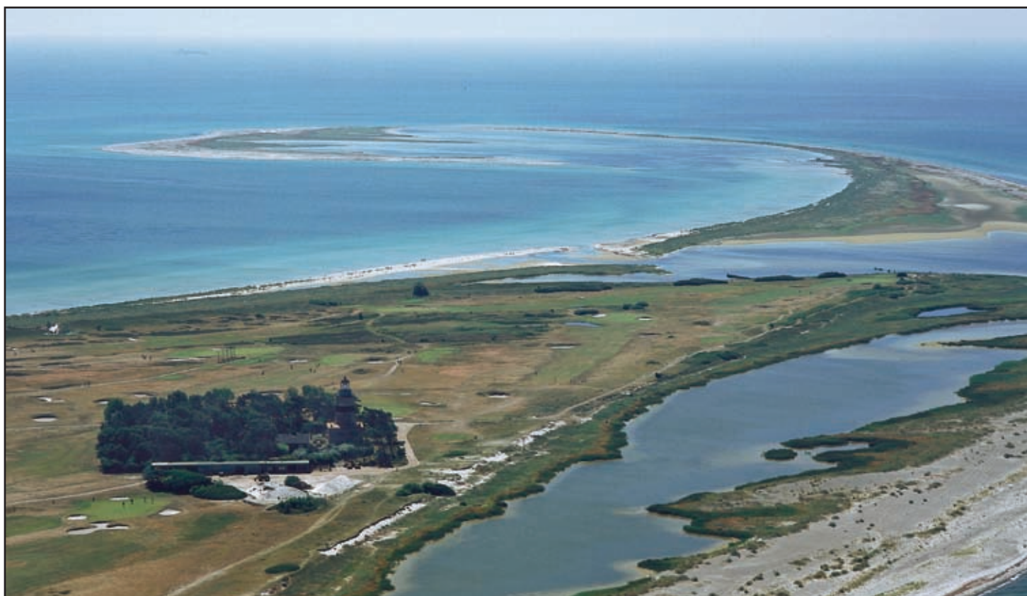
Måkläppen sedd ur två vinklar, nederst syns fyren .