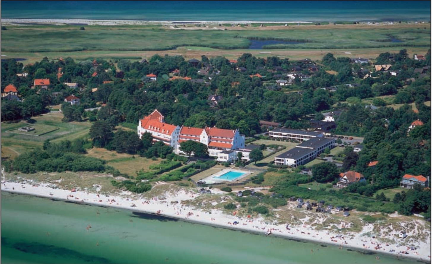
Det är i sommar 100 år sedan Falsterbohus invigdes som hotell.