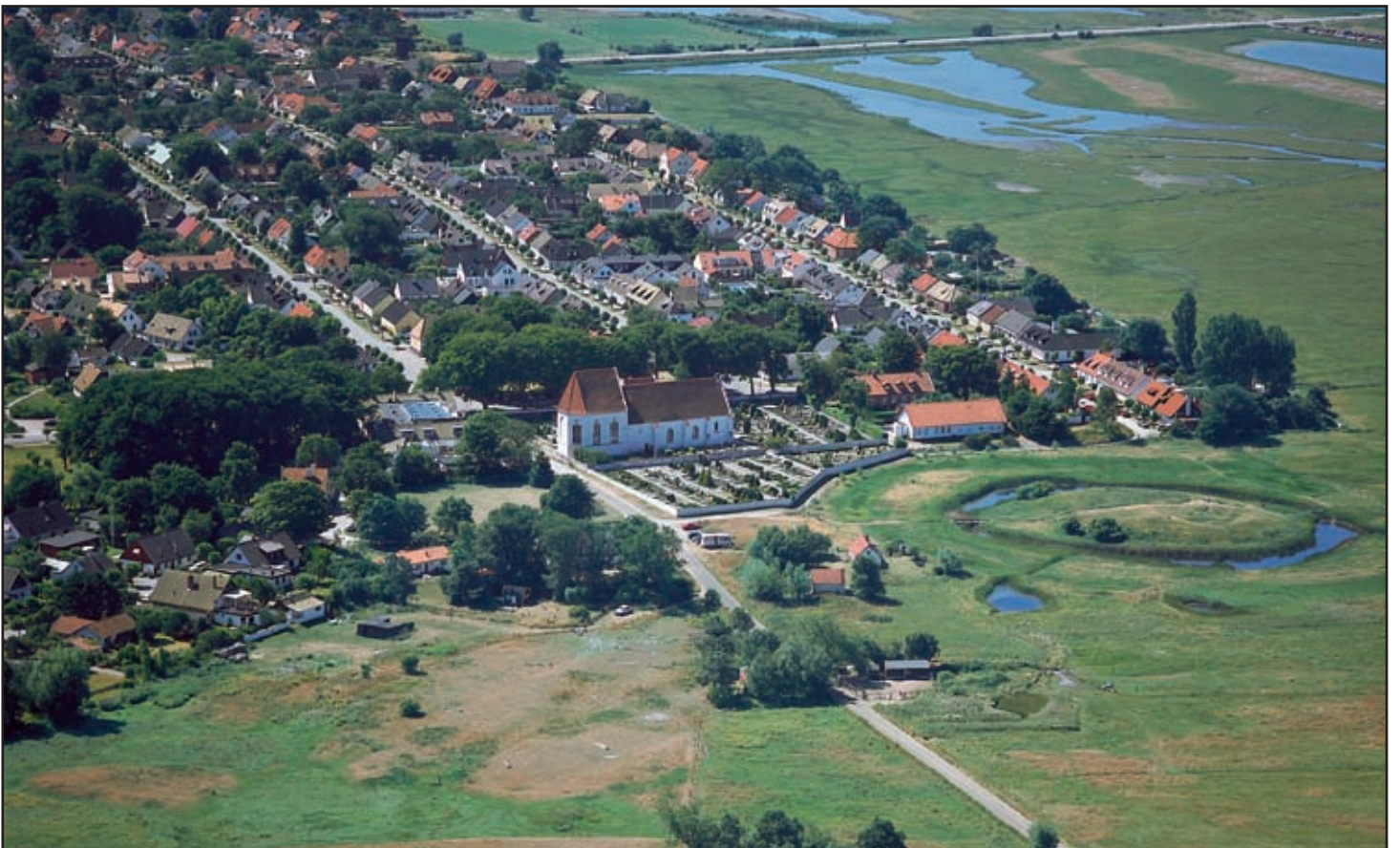
Skanörs sett från Knösen med slottsruinen till höger.