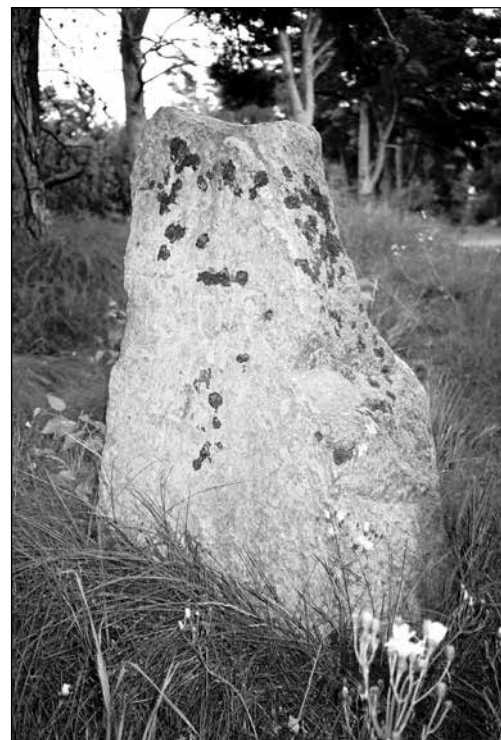
Stenen vid korsningen Bergs väg och Solidenvägen.

Året därpå satta byarna upp var sin gränssten längs det som numera motsvarar Bergs väg. Två står kvar, en sten hamnade på Falsterbo museum under 1960-talet och den fjärde – den jag letat efter – finner man