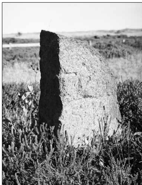
Denna sten står på golfbanan i Ljunghusen.

Sommar fortsätter: »Närvarande Byamän kunde häremot så mycket mindre förmås till någon arkänsla af thenne Herr Borgmästarens emot them viste stora gunst och bevågenhet, som the påminde sig, dels at hufvudfrågan ännu ligger under en Respective Domstols pröfning, dels ock at the många å samma marck ännu synbare teckn et fåror, höjder och åker-