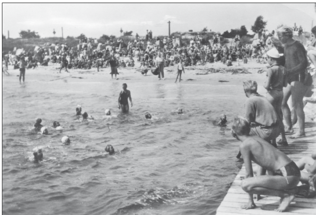
Avslutning med publik för Simskolan vid Falsterbokanalen.