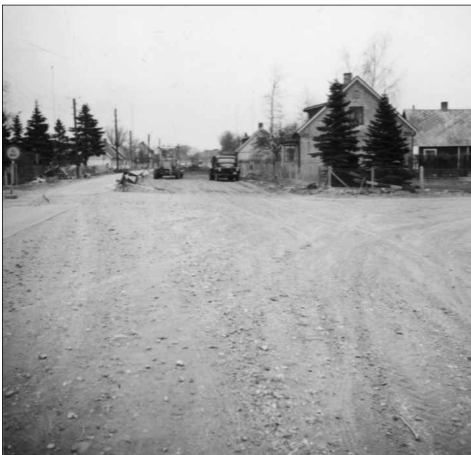
Den nya breda Malmövägen tar form medan trädgårdarna offras på bilarnas bekostnad.