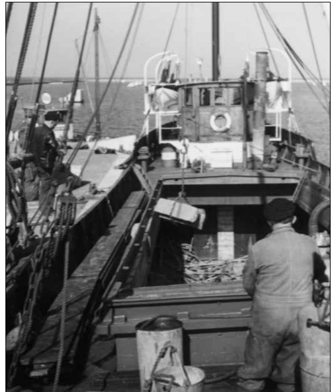
Granit från Bohuslän till vägbygget lossas i Falsterbokanalen. Observera Esso Marin II, Esso-Bengtssons bunkringsbåt i bakgrunden.