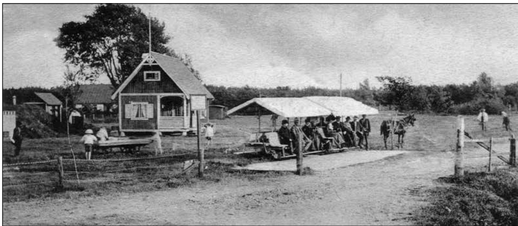
Trallan vid Ljunghusens station. Fotografen har stationen i ryggen med Falsterbovägen bortom träden