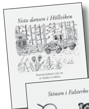
Sista dansen i Höllviken.