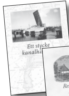
Ett stycke kanalhistoria.