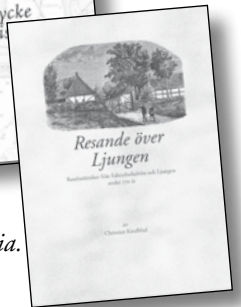
Resande över Ljungen.