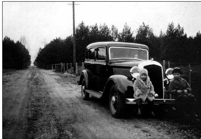
Bilden är från 1933 och visar Ljungsättersvägen som en förhållandevis bra grusväg. Mårtensvägen, som sticker av åt höger, var inte alls i samma skick på den tiden. Mitt på vägen fanns en stor sandgrop som bilen ofta fastnade i. Bilen vi ser är givetvis en Dodge. Det är Britt och jag som sitter på kofångaren.

knutar och tegeltak. Fast från allra första början var huset brunt med papptak. Någon har berättat att nästan alla hus, som byggdes vid den tiden var bruna eller tjärade. Huset är inte stort, men vi tycker att »Puttebo» är den idealiska sommarstugan.