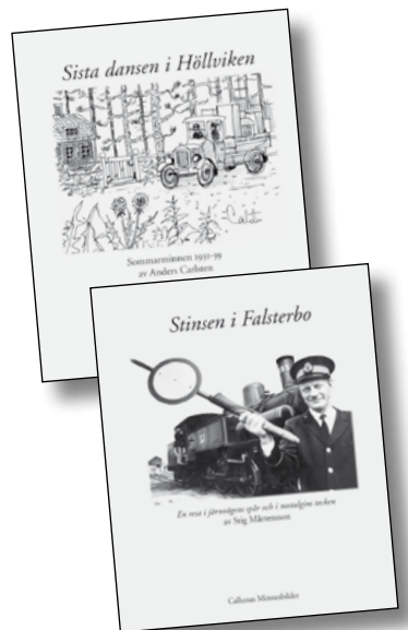
Sista dansen i Höllviken. Pris 130 kr.