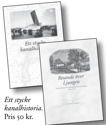
Ett stycke kanalhistoria. Pris 50 kr.