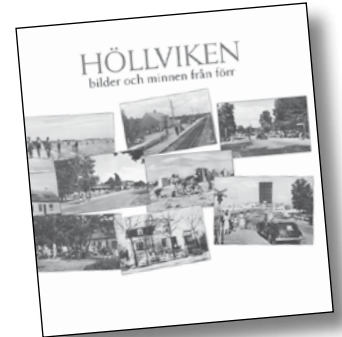
Höllviken – bilder och minnen från förr. Ny upplaga ute till jul. Pris 140 kr.

Böckerna finns att köpa på biblioteken i Höllviken och Skanör samt på Bärnstensmuséet i Kämpinge, Falsterbo Museum och Turistbyrå vid Falsterbokanalens samt på ICA-Toppen i Höllviken.