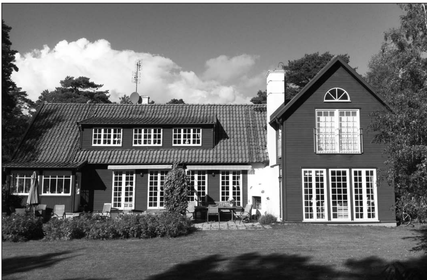
Villa Optimism i sin nuvarande skepnad.