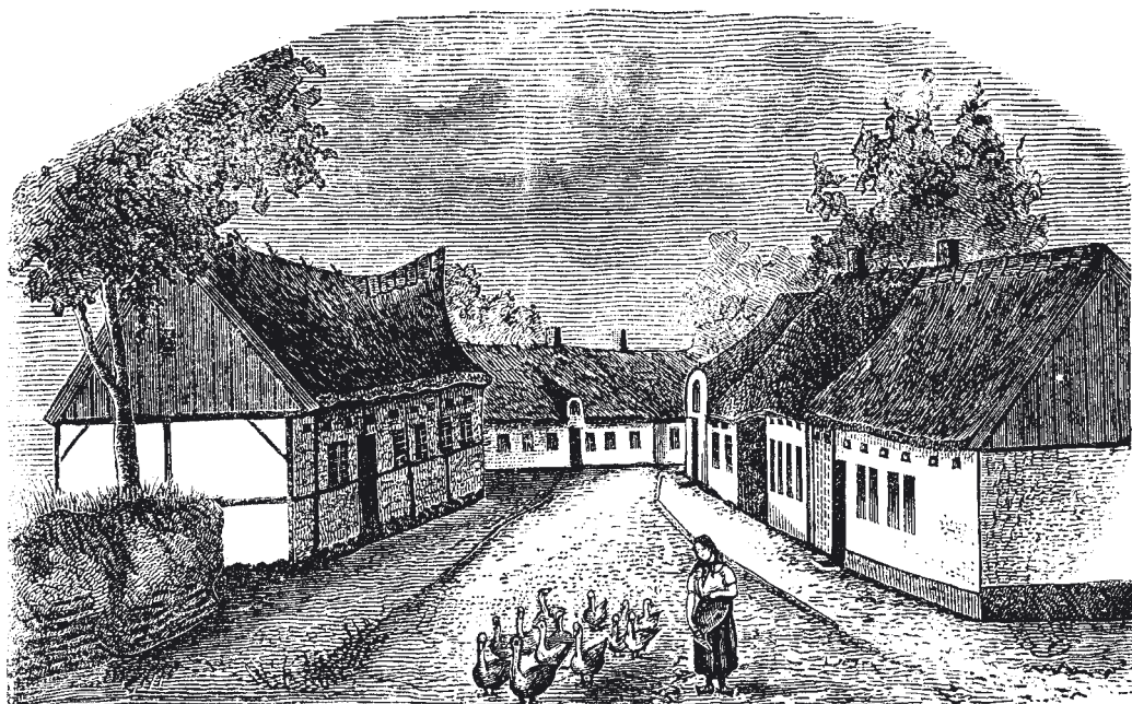
Skanör 1879, teckning av A.P. Erikson.