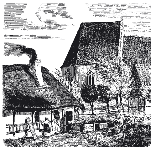
Värnen norr om kyrkan i Skanör 1867, teckning av A. T. Gellerstedt.

Boken kostar 65 kr och finns att köpa på bl.a biblioteken.